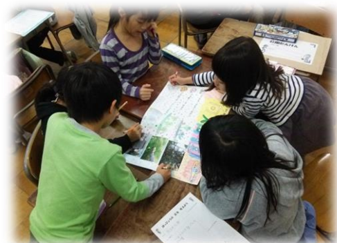
「この公園のおすすめポイントは何だろう?」 ~公園のふしぎを かいけつしよう!~ 2年生