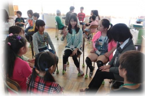
「ジェスチャーで表すのはむずかしいな」 ～手話で伝えよう～ 4年生