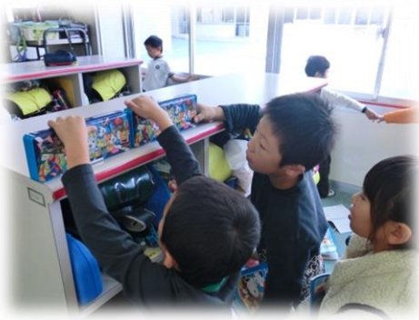
「どうやってくらべたらいいのかな」 ~算数 ながさくらべ~ 1年生