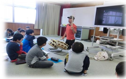
「音楽にこめられた『想い』を知ったよ」 ～和太鼓演奏者の方の聞き取り～ 5年生